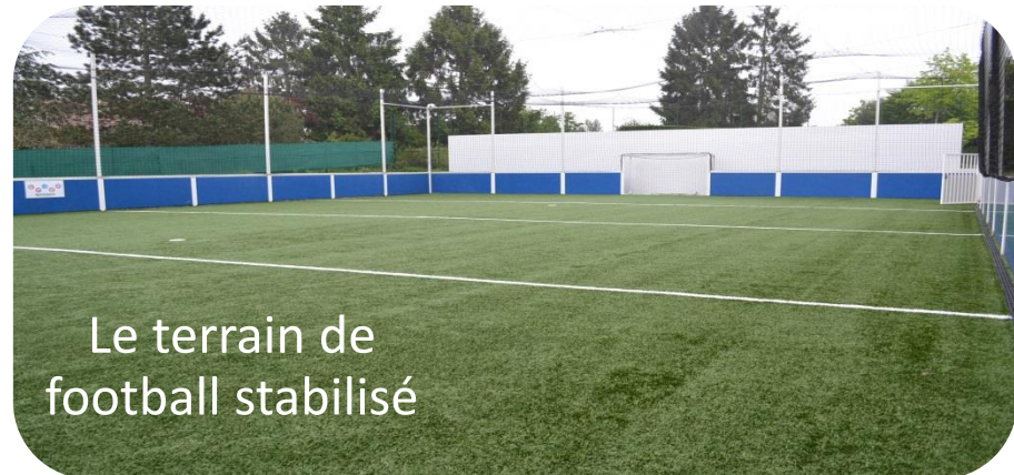
Le terrain de football stabilisé