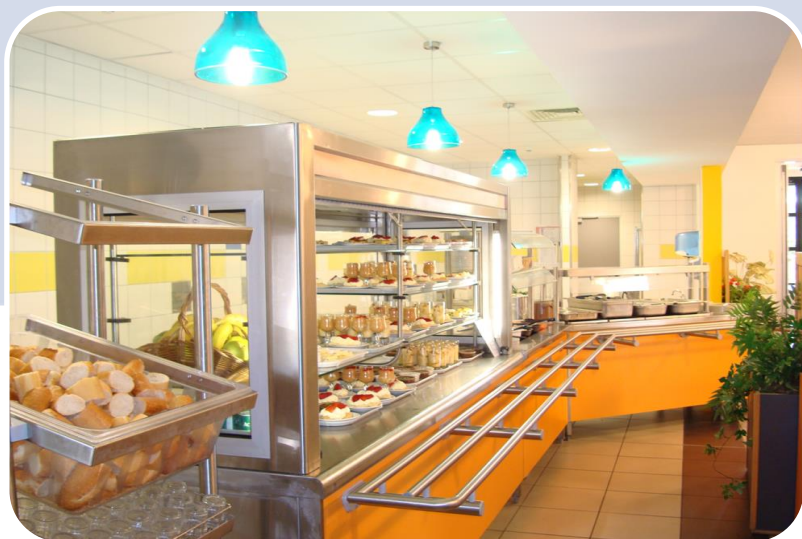
Le self service